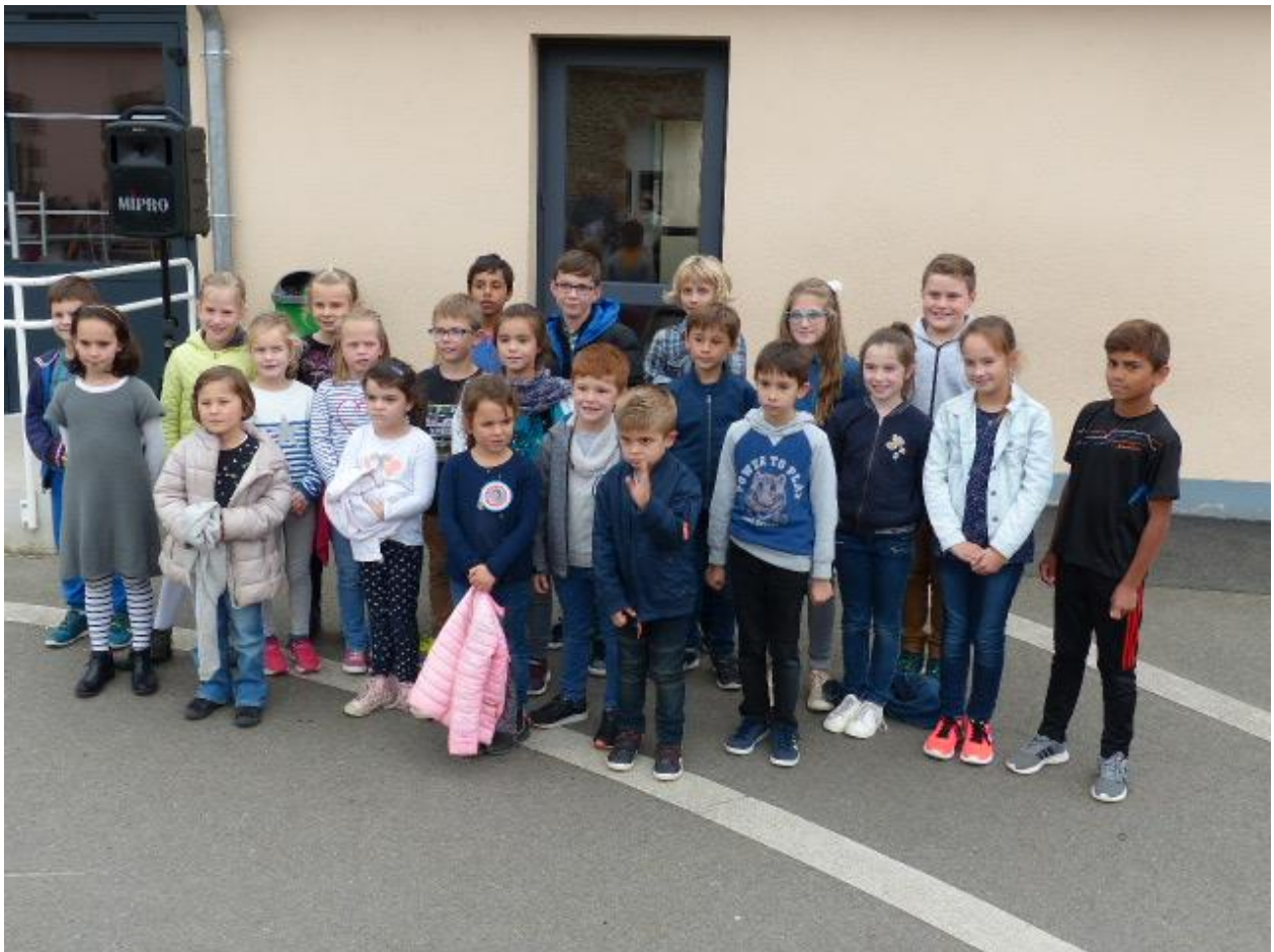
Elèves élus délégués ou suppléants / élections du 10/10/17

La première réunion a eu lieu ce mardi 17 octobre en voici l'ordre du jour :