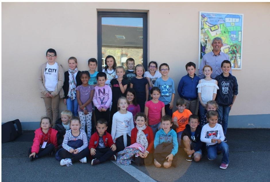
Elèves élus délégués ou suppléants / élections du 04/10/18

La première réunion a eu lieu ce lundi 15 octobre.