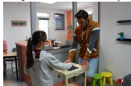
Vote dans le bureau du directeur